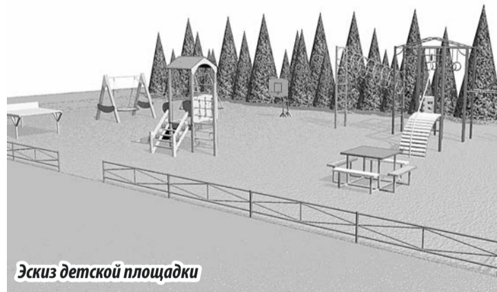
Эскиз детской площадки

Жители очень надеются на победу в конкурсе и готовы принимать активное участие в реализации проекта.