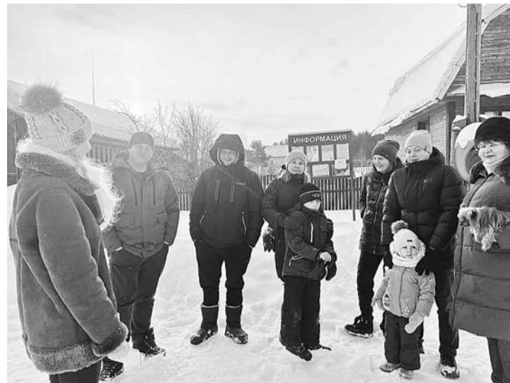
Большинство жителей поселения — за обустройство детской площадки в д. Бутырки

Таким образом, сегодня имеется чёткое понимание о проведении ремонтов улично-дорожной сети города Боровичи на сумму 45,4 млн. рублей.